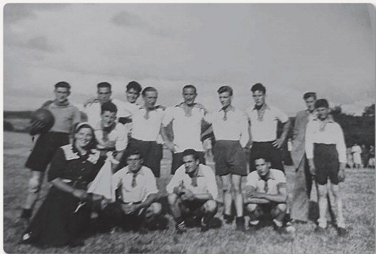
O BURGO (SAN VICENTE) Equipo de fútbol da parroquia, anos 50