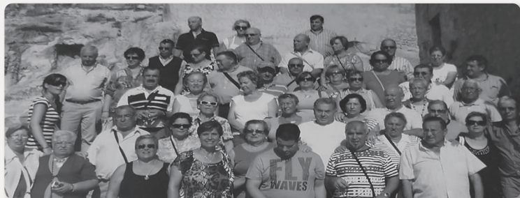
CARBALLIDO (SAN MARTIÑO) Excursións da veciñanza da parroquia