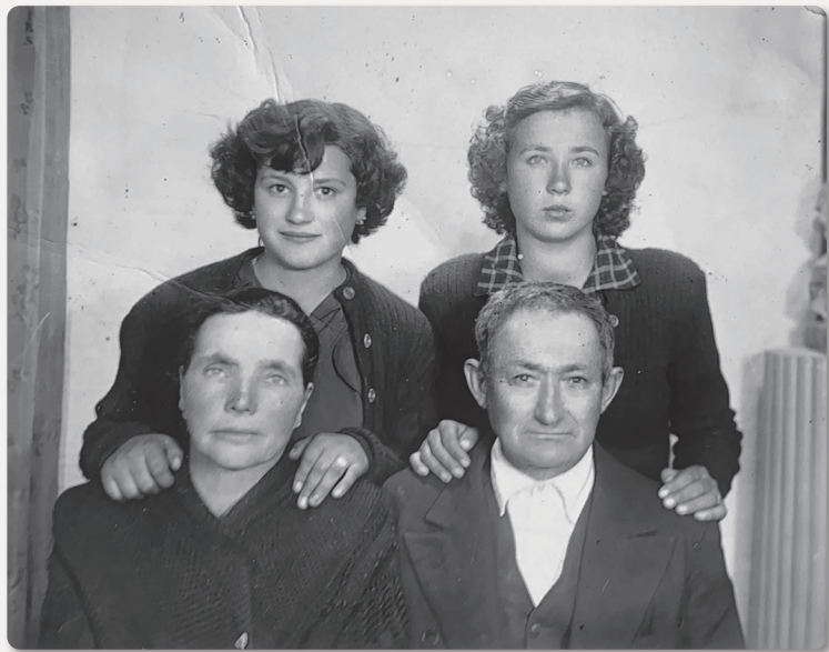
SAN MAMEDE DOS ANXOS Estampa familiar [s.d.]